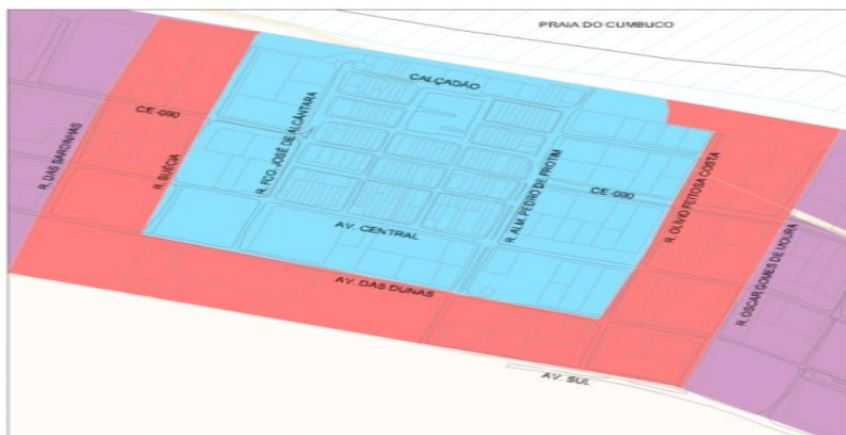
ZONA ESPECIAL DE INTERESSE TURÍSTICO: ZEIT - 3 VILA DO CUMBUÇO, ZEIT - 4 VILA DO CUMBUÇO - AMORTECIMENTO ESCALA: 1/5.000